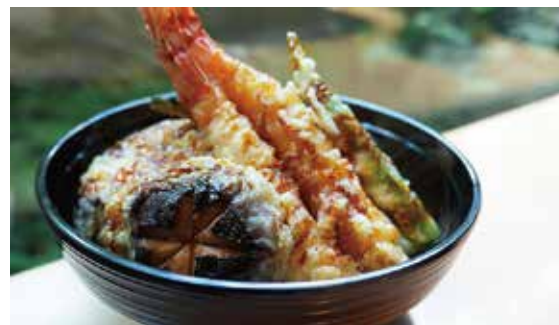
海老と野菜の天井 Shrimp and vegetable tempura rice bowl ¥1,500