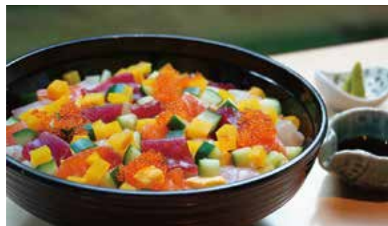
海鮮ばらちらし丼 Assorted seafood chisashi bowl ¥1,500