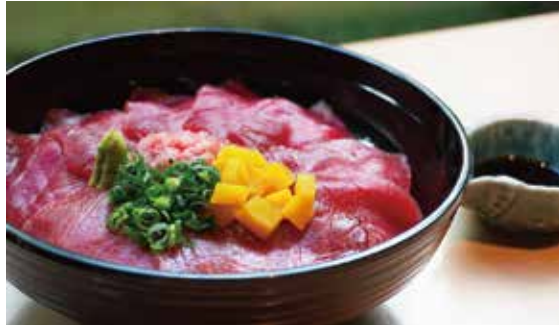
本マグロ御膳 (中トロ・赤身) Premium Tuna sashimi set (Tuna sashimi medium-fatty & lean) ¥2,900

※Miso soup is not included with the Sesame sauce flavoured sea bream with rice soaked in broth set.