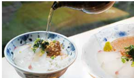
鯛の胡麻だれ 出汁茶漬け御膳 Sesame sauce flavoured Sea bream with rice soaked in broth set ¥2,500