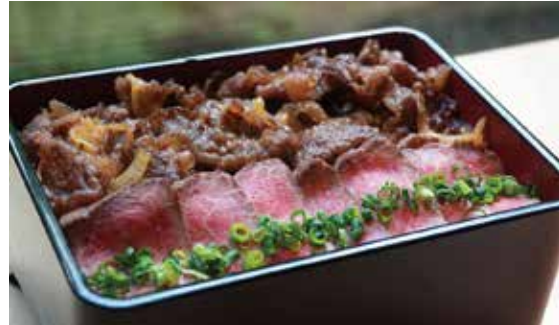
和牛贅沢御膳 (ローストビーフ・タレ焼き) Wagyu beef luxury set (Roast beef & grilled beef) ¥2,900