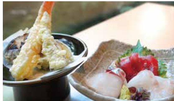
天ぷら・刺身御膳 Tempura & Sashimi set ¥2,500