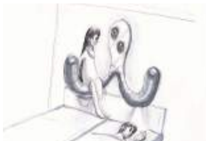
ヤノベケンジ ROOMイメージ